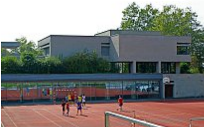
Schulhaus Loreto Zug: Die Klasse von Karin Bachmann, Klasse R3b, erhielt ebenfalls einen Reisegutschein.

2376 Schulklassen aus der ganzen Schweiz haben beim Wettbewerb «Experiment Nichtrauchen» mitgemacht. 1660 davon haben erfolgreich abgeschlossen. Weil Kinder und Jugendliche für Tabakwerbung besonders empfänglich sind, bleibt die Sensibilisierung wichtig.