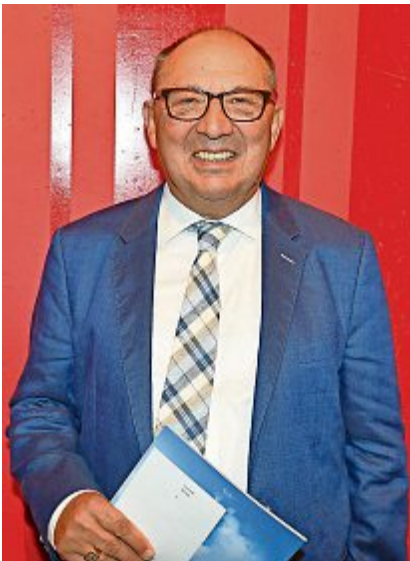
Sportreporter-Legende Bernard «Beni National» Thurnheer gibt sich im kleinen Kanton Zug die Ehre.